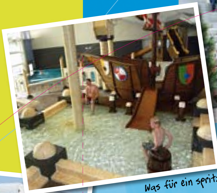
Was für ein spritziges Vergnügen!