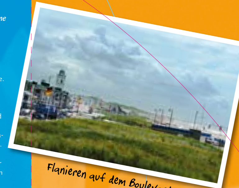
Flanieren auf dem Boulevard...

Dünenhäuschen 6 (Bungalow für sechs Personen): der Wohnbereich und die Essecke sind durch eine massive Treppe getrennt, die zum ersten Stock führt. Küche mit Spülmaschine, großem Kühl-/Gefrierschrank und Mikrowelle. Das Schlafzimmer im Erdgeschoss hat zwei Einzelbetten und einen zusätzlichen Fernseher. Oben befinden sich zwei weitere Schlafzimmer mit jeweils zwei Einzelbetten. Unten gibt es ein Badezimmer mit Badewanne, eine separate Toilette und eine Abstellkammer. Oben befindet sich ein zweites Badezimmer mit Dusche und Toilette. Terrasse mit Gartenmöbeln.