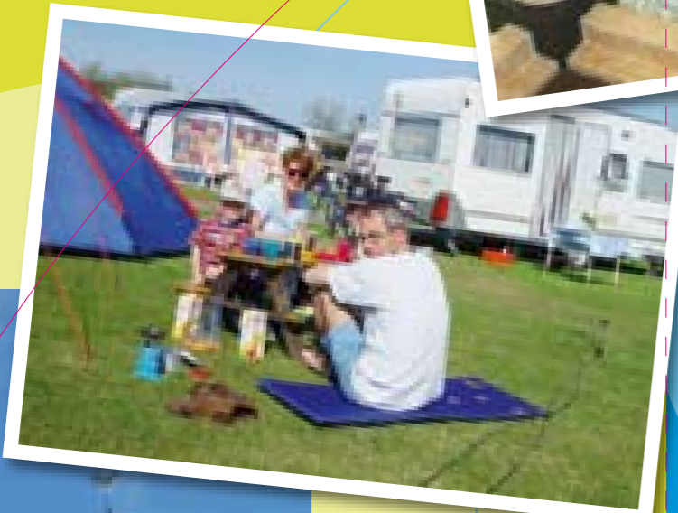
Picknick neben dem Zelt.